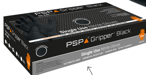
Per 50 stuks verpakt in aantrekkelijke dispenserbox